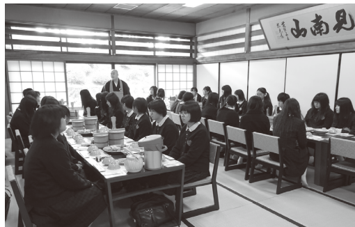
萬福寺で普茶料理をいただく

私たち食物科は修学旅行を通して様々な食文化を体験してきました。萬福寺では普茶料理をいただき、宇治茶の工場見学では石臼で抹茶作りを体験し、美味しいお菓子とともにごきたてのお抹茶を頂きました。京都の台所、錦市場は食材の宝庫でした。中でも様々な京野菜は、色も形も個性があつて、味もしっかりと