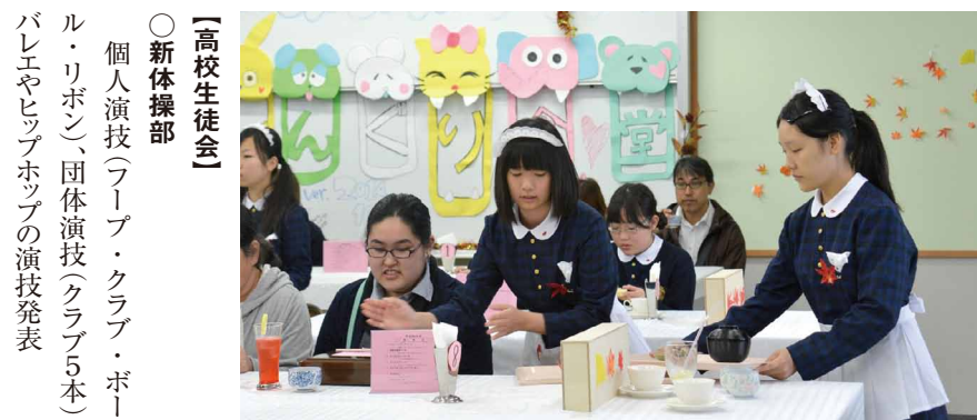
【高校生徒会】 ○新体操部 個人演技クラブ・クラブ・ボール・リボン、団体演技(クラブ5本)パレエヒップホップの演技発表

◆ 附属高校 【食物科】 どんぐり食堂を開設。皆さんに心温まるサービスと美味しいお食事を提供した。