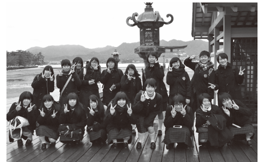
厳島神社・高舞台にて

2日目は平和記念公園を訪れ、被爆体験をされた方の講話をお聞きして胸が痛くなりました。戦争は絶対にしてはいけないと思いました。午後は大阪に移動し、楽しみにしていたUSJ・ホグワーツ城が見えた時に興奮はマックスに達し、思いきり映画の世界に浸りました。