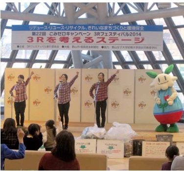
キャンペーンを盛り上げる幼児教育科の学生

郡山市主催によるゴミゼロキャンペーン「リサイクルを考えるステージ」が10月25日、イトーヨーカドー郡山店で開催された。短大・幼児教育学科の学生40人がボランティア活動の一環として参加、好評を博した。学生たちは授業で学んでいる表現活動体験を生かして、ポイ捨て防止やリサイクルの大切さを訴えた。