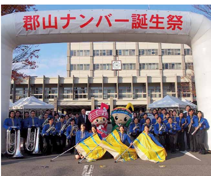
11月17日(月)郡山市役所庁舎前

マーチングバンド部が、郡山ナンバー誕生祭の開幕に、新しくなったユニフォーム(ロイヤルブルーのジャケツと黒のパンツ)で花を添えました。