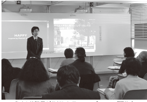
多くの教職員が参加したラーニングコモンズ研修会

郡山女子大学では平成26年4月より62年館の2階および図書館棟の3階に「ラーニングコモンズ」をそれぞれ設置した。ラーニングコモンズとは、文部科学省が「学修環境充実のための学術情報基盤の整備について（審議まとめ）」（文部科学省科学技術・学術審議会 学術分科会 学術情報委員会、平成25年8月）に基づき推進しているアクティブラーニングのための空間である。学生がディスカッションやプレゼンテーションを実際に体験し、学生・社会人としてそれらに必要な技能を自修することを目的としている。