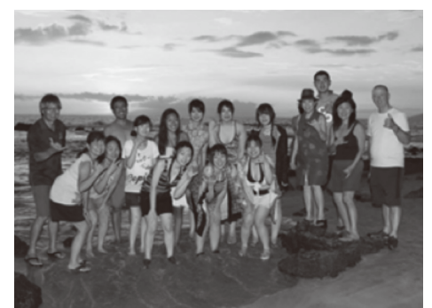
マウイの夕日をバックに

充実した一週間でした。また機会が あるなら、今度はもっと英語を勉強 して再びハワイ、マウイ島を訪れたい と思います。Mahalo!