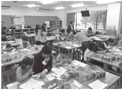
ミニロボット作りに取り組む参加者

ワクワクの社は本学の教職員6名で構成され、地域の子どもたちに自然や科学に興味・関心を持ってもらうことを目的に今年5月に発足した。来年度以降も継続的に活動を行う予定。なお、「ミニロボをつくろー！」は国立青少年教育振興機構「子どもゆめ基金」の助成事業である。