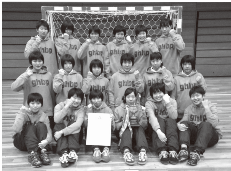
初優勝に喜ぶ選手達