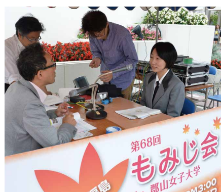
○書道部 生徒たちが楽しんで仕上げた半紙、画仙紙など様々な作品を展示した。