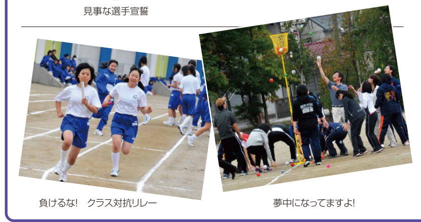
見事な選手宣誓 負けるな! クラス対抗リレー 夢中になってますよ! うまく逃げましょう はい ジャンプです!

◆ 短大 【家政科・福祉情報専攻】 学生の手芸作品とボランティア活動紹介の展示、手作りの小物と地元農産物の販売に加え、「絆ストラップを作ろう」「革のコースターを作ろう」「アンプレートを楽しく作ろう」の3講習会を開催した。 【家政科・食物栄養専攻】 日本人の長寿を支える健康な食事「和食の魅力」を探った。