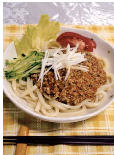
大賞に輝いた「カツオのジャーザー麺」

「ひき肉の代わりにカツオを使い、栄養のある魚を子どもたちにおいしく食べてほしいと考えたレシピです。大賞を取れて嬉しいです」と喜びを語った。レシピは今後、給食や飲食店などで活用される。