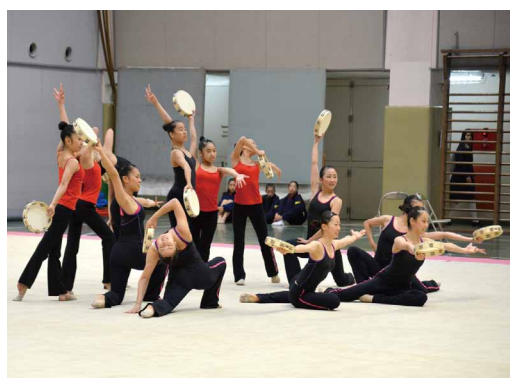
○書道部 生徒たちが楽しんで仕上げた半紙、画仙紙など様々な作品を展示した。