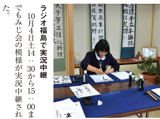
○書道部 生徒たちが楽しんで仕上げた半紙、画仙紙など様々な作品を展示した。