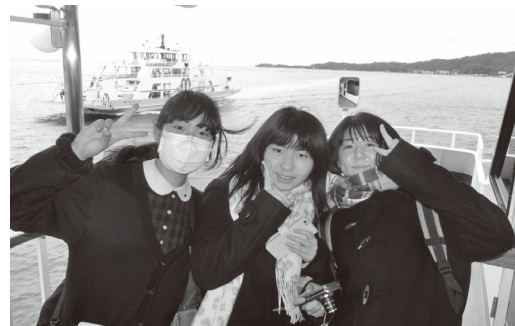
フェリーに乗って

奈良・京都では長い歴史を美し、いまも耐えてきた様々な建築物や、信仰を支えた仏像や彫像、絵画等の存在感に圧倒され、特に興福寺宝物