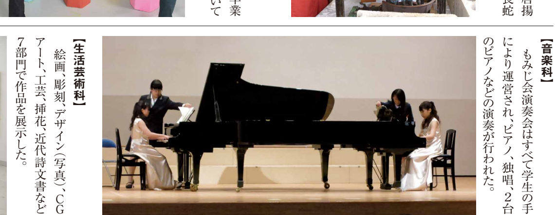
模倣店「メイフルガーデン」 学生が中心となり、焼そば、唐揚げ、フライドポテトなどを販売、長蛇の列ができた。 【音楽科】 もみじ会演奏会はすべて学生の手により運営されピアノ、独唱、2台のピアノなどの演奏が行われた。