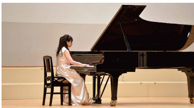
高度なテクニックで演奏する学生

郡山開成学園オーケストラでは、同学生15人と附属高校の生徒17人がハチャトウリアンの「仮面舞踏会」を演奏し、会場から大きな拍手が送られた。