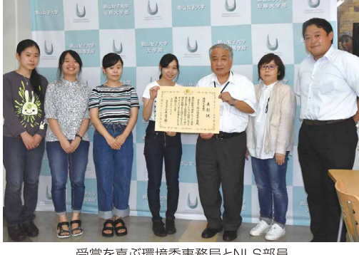
受賞を喜ぶ環境委事務局とNLS部員

評価されたのは①教職員による環境委員会と学生によるナチュラライフスタイル部(NLS)を中心に、エコ検定のサポート等も行い、年間を通じて環境教育を実施②産学官との連携強化や地域活性化などを推進する「地域連携推進室」を設