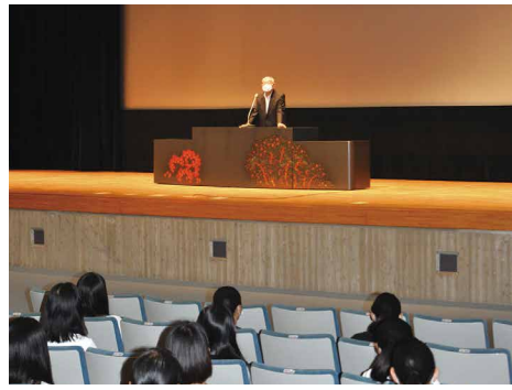
全体会での学長挨拶

参加者は入試制度や修学支援制度、各学科の履修内容について、熱心に説明を聴き理解を深めた。学園の雰囲気を知ってもらうため、高校生にはウェルカムスイーツを配り、図書館や実習施設などの見学も繰り広げた。