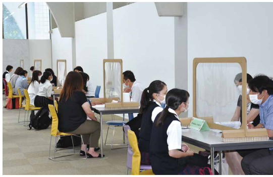
飛沫を遮るパネルを配しての個別相談

当初、6月に第1回を予定したが、新型コロナウイルス感染症の状況を考慮し、1カ月遅れのスタートとなった。定員を決めた事前予約制とし、全体会や各学科の説明では間隔を空けて座り、飛沫を遮るパネルを配置して個別相談も行った。密集を避けるために学生との交流の場は設けず、教職員だけで対応するなど感染防止に努めた。