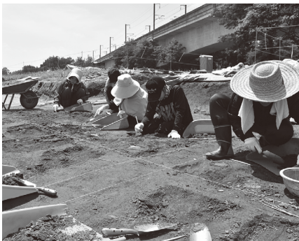
炎天下の発掘作業