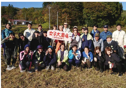
村民の方々とえごまの収穫

これからも継続的に村民の皆様と交流の機会を持ち、女子大生の若い力で、村をさらに元気にしたいと思っています。葛尾村では、食物栄養学科だけでなく、健康栄養学科、地域創成学科、幼児教育学科でもそれぞれ活動を行っています。興味のある方は、ぜひ葛尾村での活動にご協力ください。